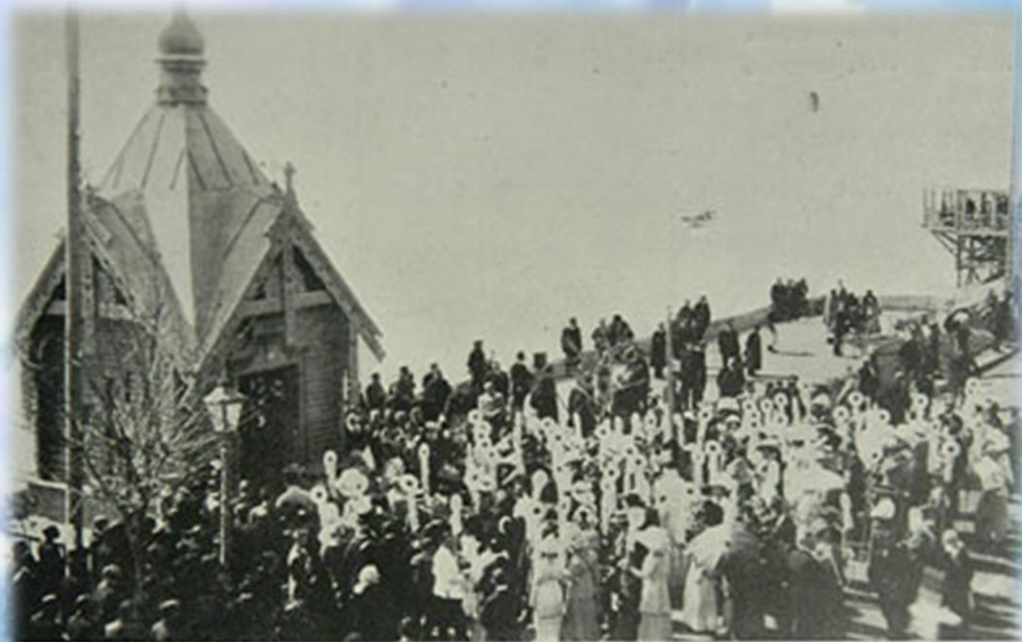
Ялта. Молебствие у часовни на набережной в день «благословения».

На всех мероприятиях акции ежегодно трудились дети царской семьи.