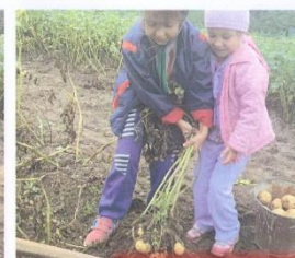
Мы с сестрой еще не умеем копать. Зато мы дружно помогаем дедушке и хорошо собира...