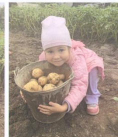
Вот какой у нас урожай!