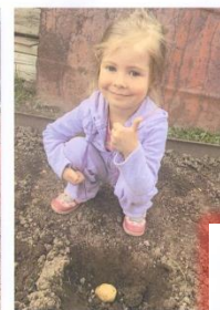
Потом с дедом мы сажали картошечку!