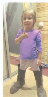
Скоро осень! Надо копать картошку!!