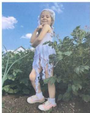
Вот какая высокая ботва у нашей картошки была в середине лета.