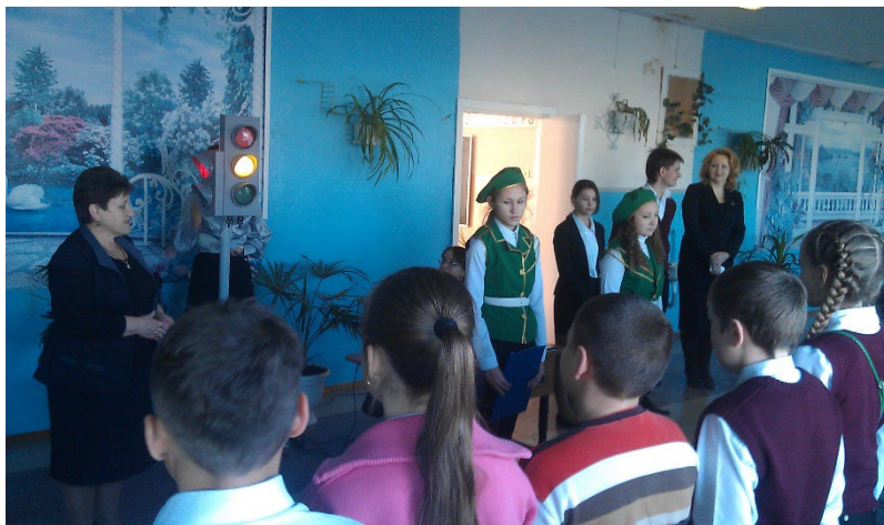
Линейка, посвящённая началу олимпиад